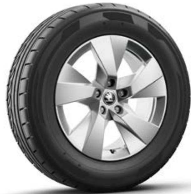
17" Paget aero