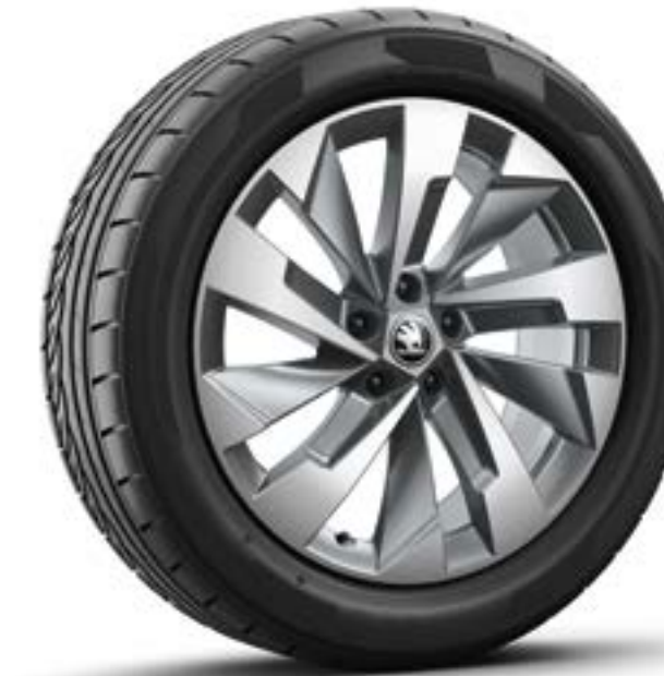
19" Halti aero, antraciet