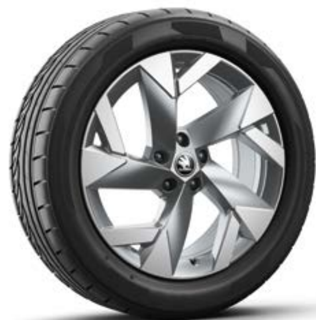
19" lichtmetalen velgen Tirsuli aero, antraciet