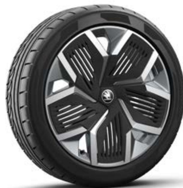
20" Rila aero, antraciet zwart