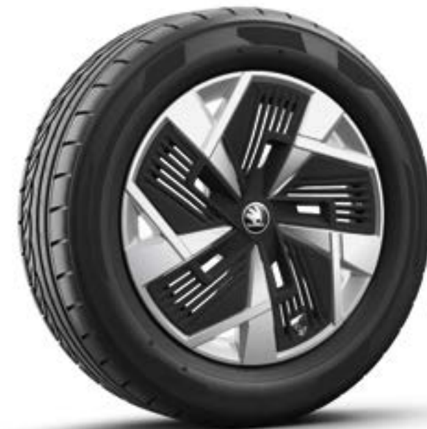
18" Mazeno aero