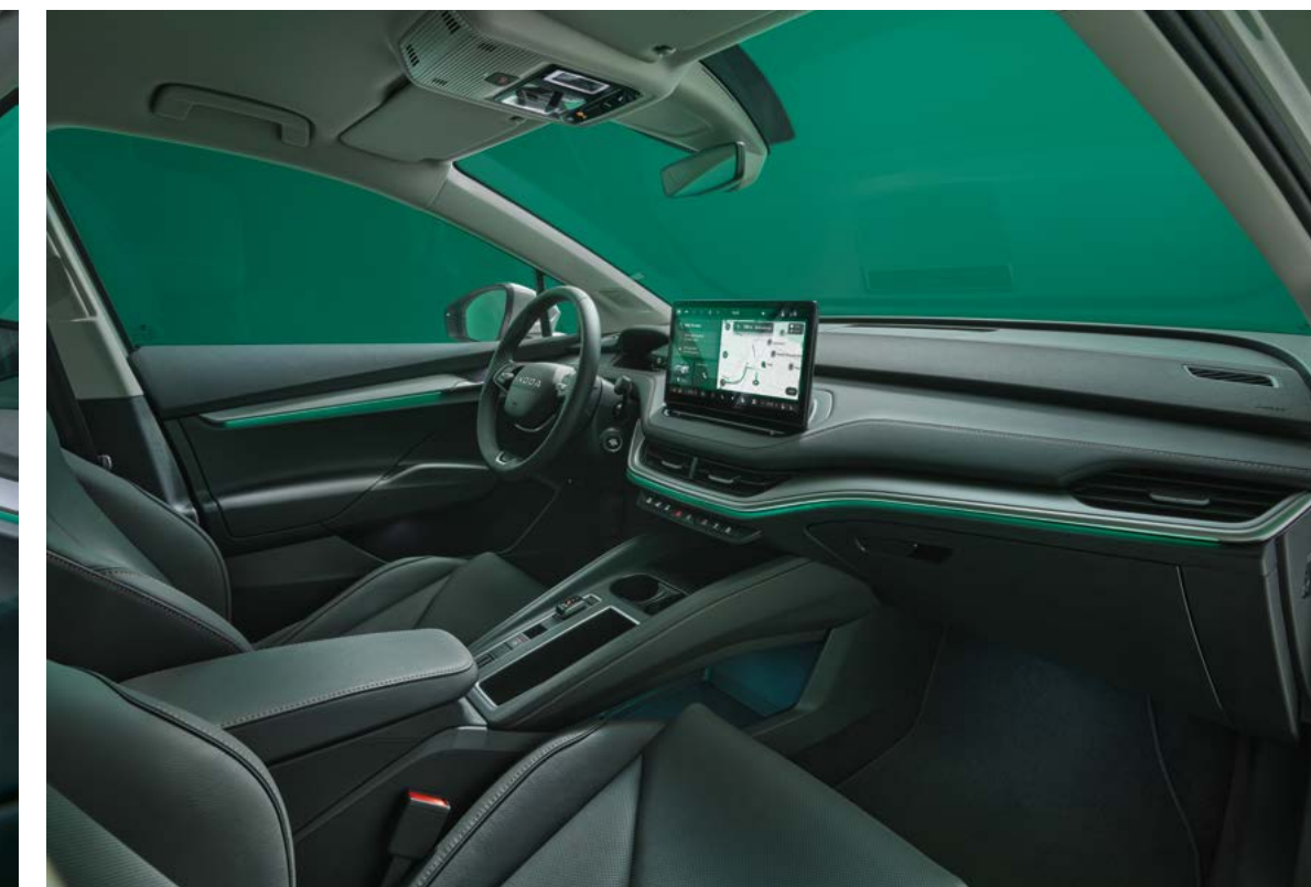
Eco Suite interieur design selectie