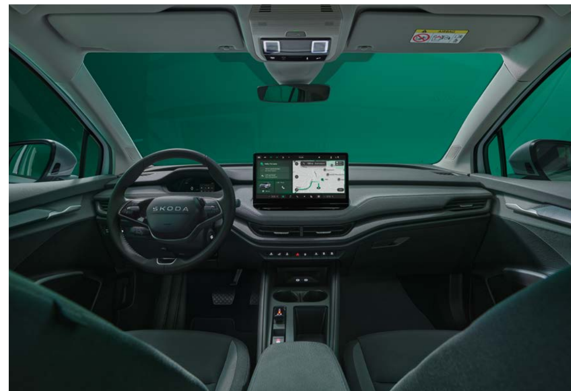
Studio interieur design selectie