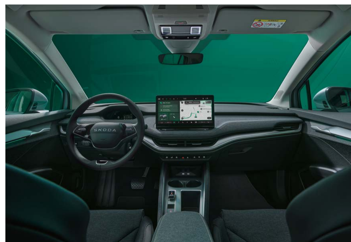
Loft interieur design selectie