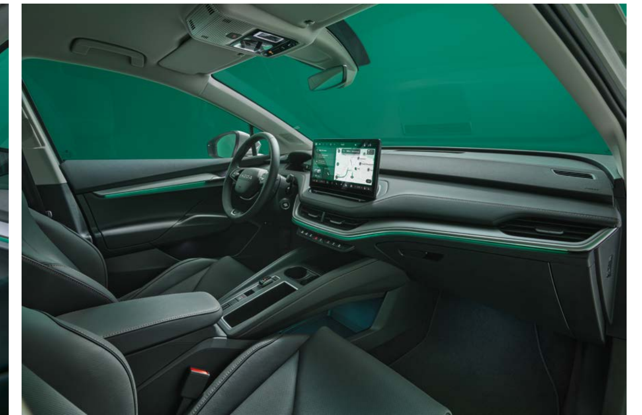
Suite interieur design selectie