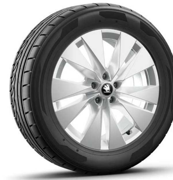
19" Proteus zilver