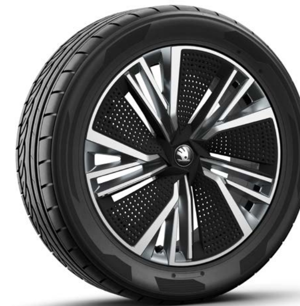
20" Neptunus antraciet