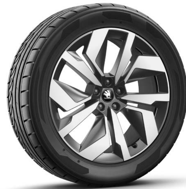
20" Vega metallic zwart