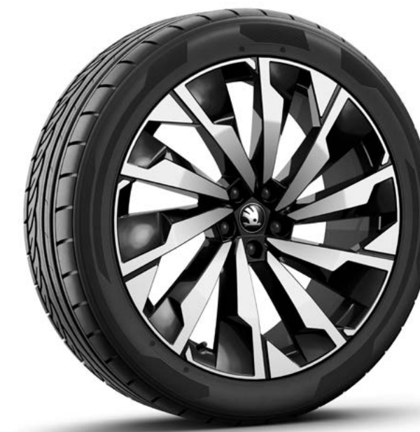
21" Supernova zwart