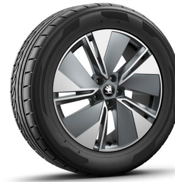
19" Regulus antraciet