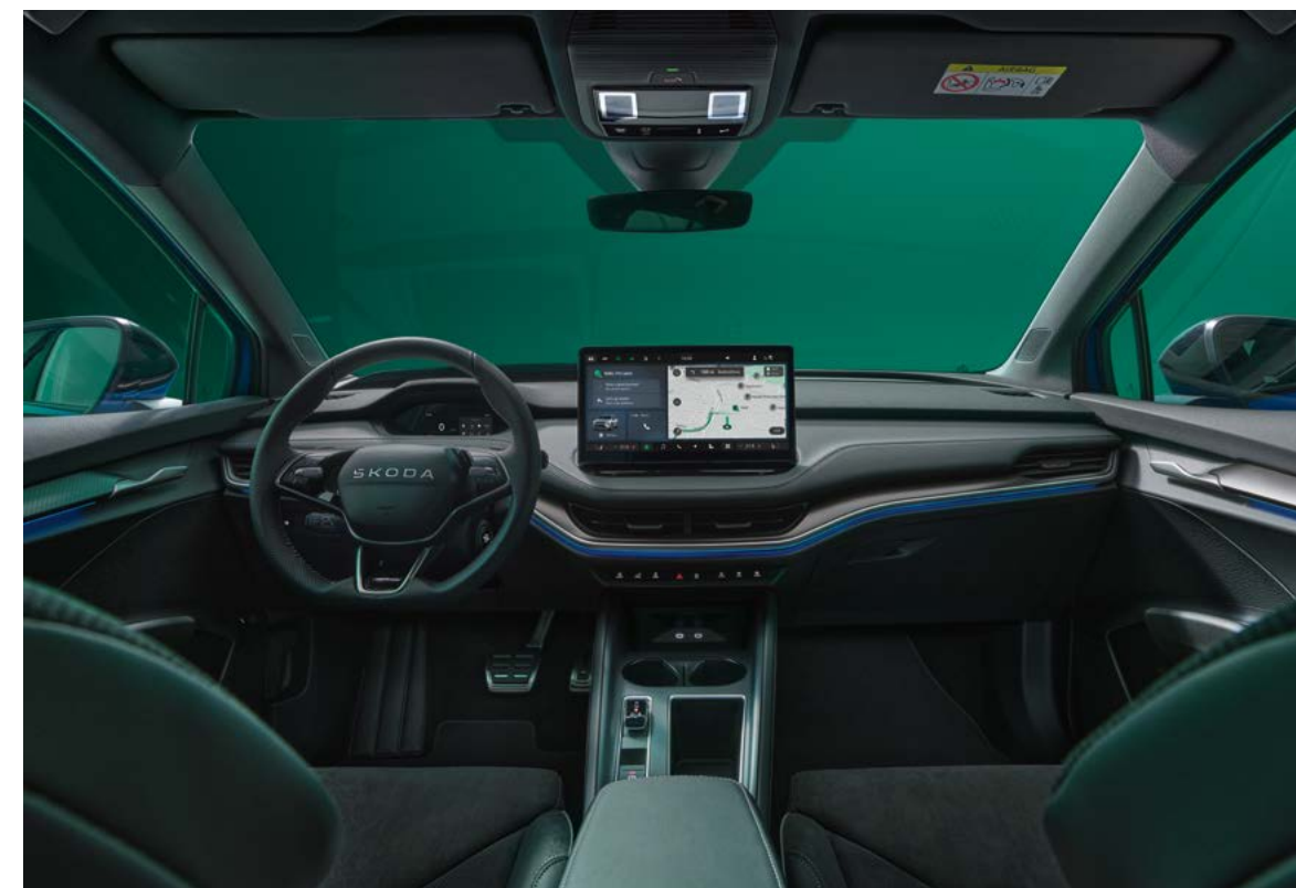
Sportline interieur design selectie