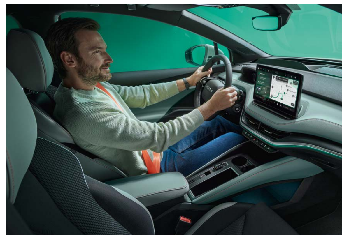
Lodge interieur design selectie