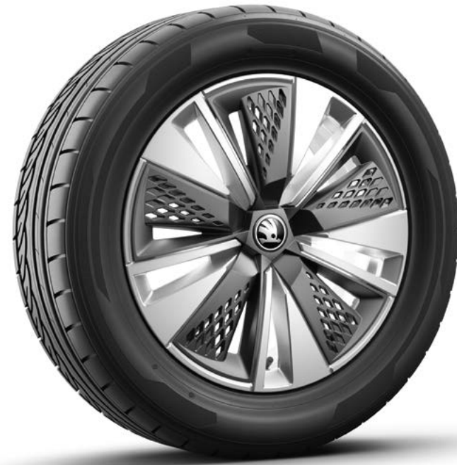
17" Scutus zilver